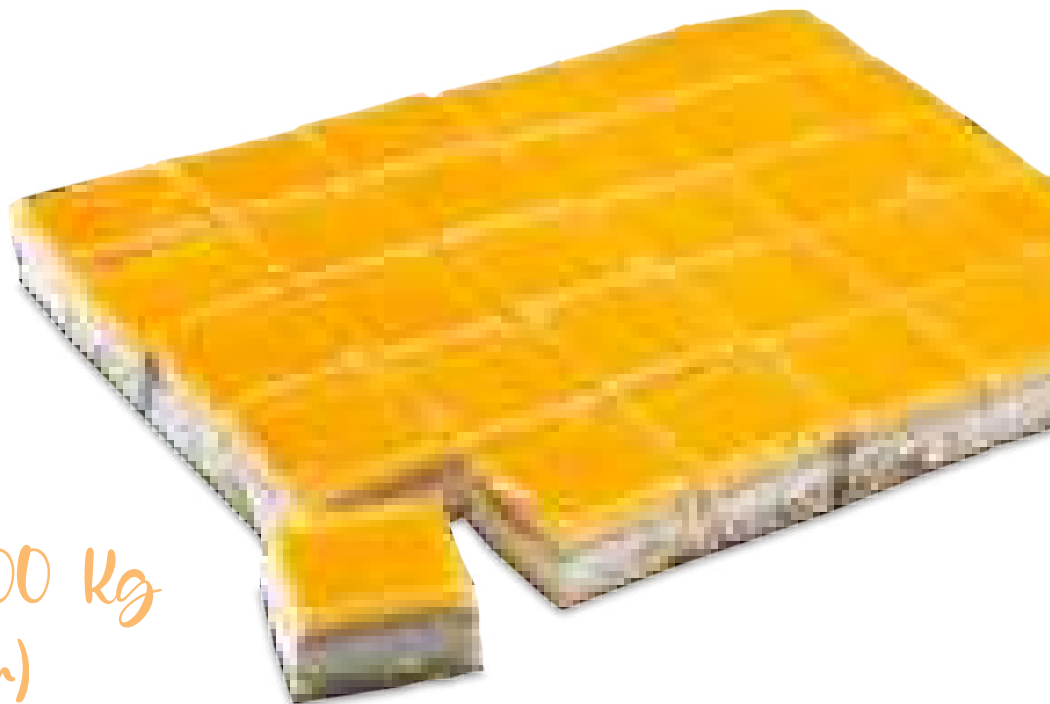
San Marcos 1,500 Kg (Sin Azúcar) (30 Raciones y Sin Racionar)