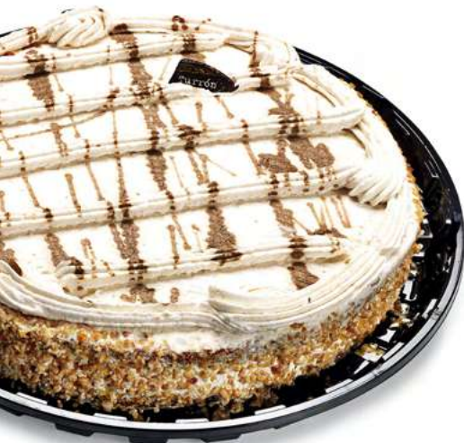
Turrón (1 Kg)