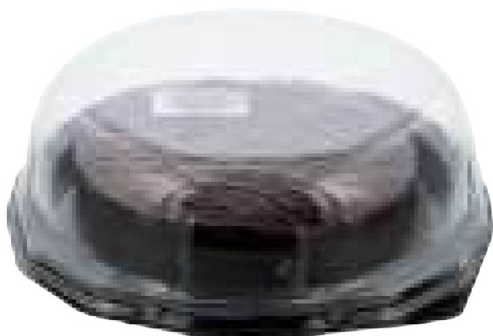
Sacher Frambuesa (650 gr)