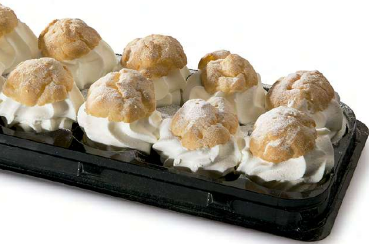
Lionesa sabor Nata (10 unidades)