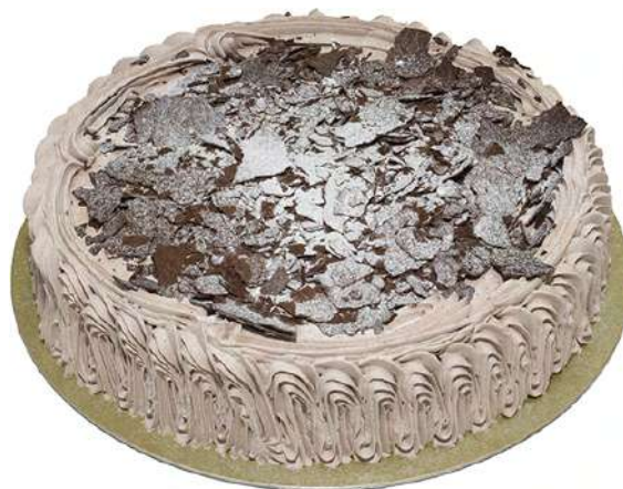
Selva Negra (1 Kg)