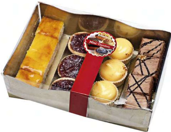
Bocaditos de Nata/Trufa (10 unidades)