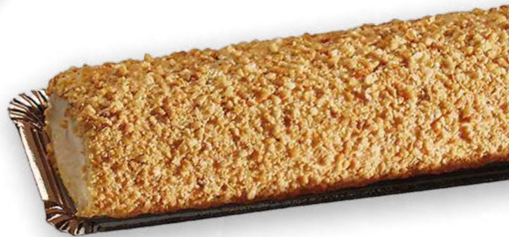
Crocanti (1 Kg)