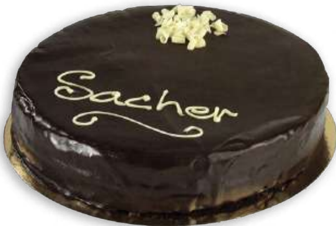
Sacher (12 Raciones)