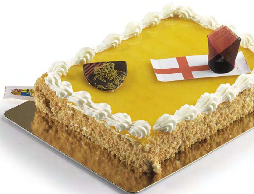
Lanzón de San Jorge (550 gr)