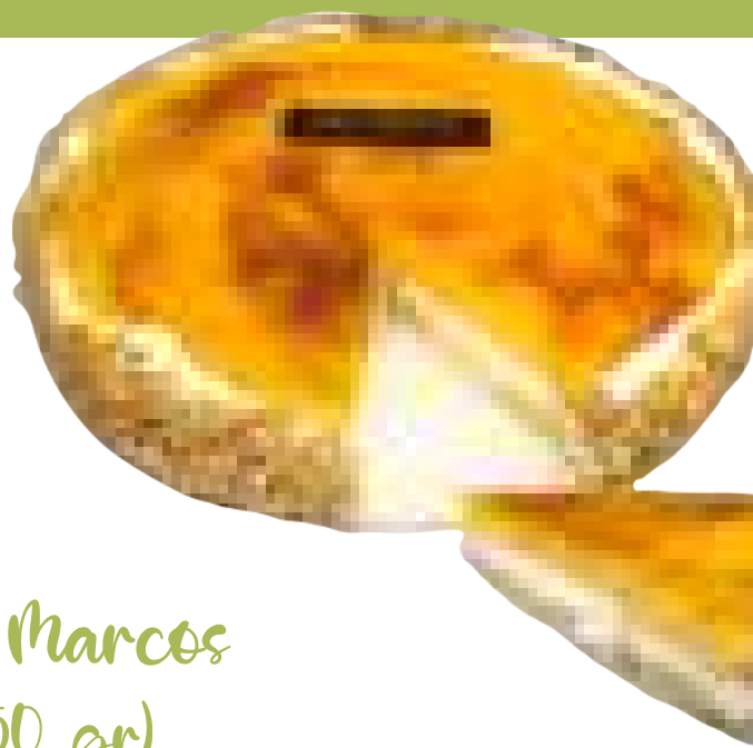
San Marcos (550 gr)