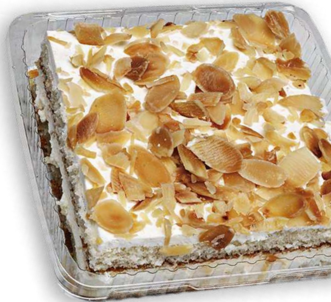
Pastel Sara (125 gr)