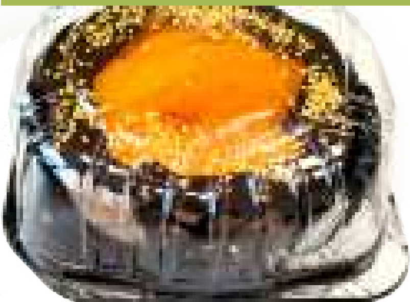
Massini (750 gr)