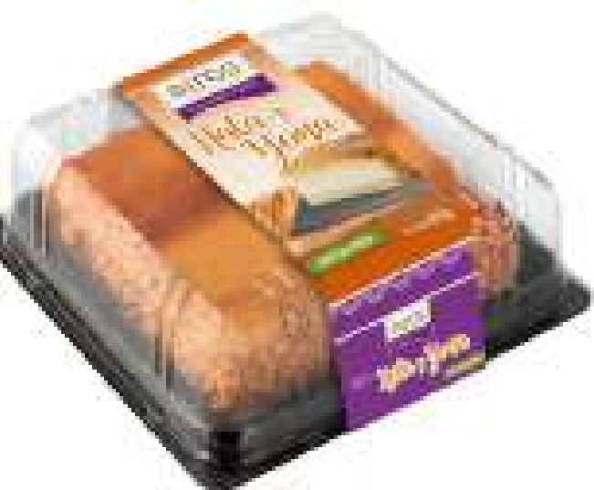
Yema (410 gr)