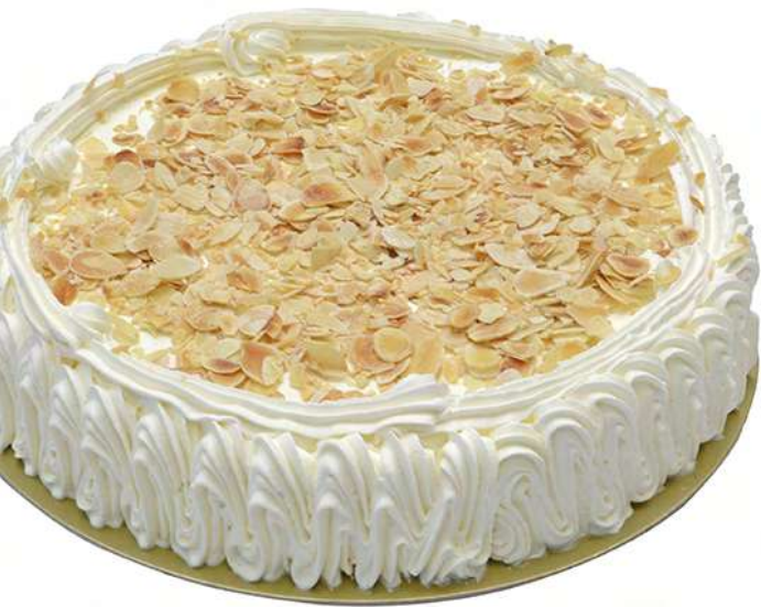
Nata-Almendra (1 Kg)