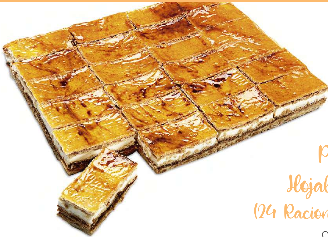
Premium Hojaldre-Yema (24 Raciones • 2,400 Kg)