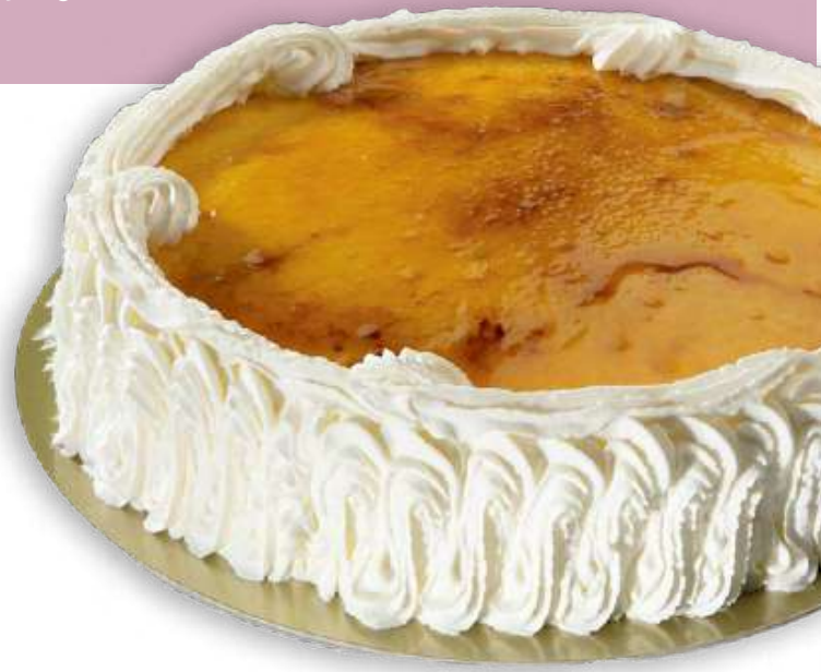
San Marcos (1 Kg)