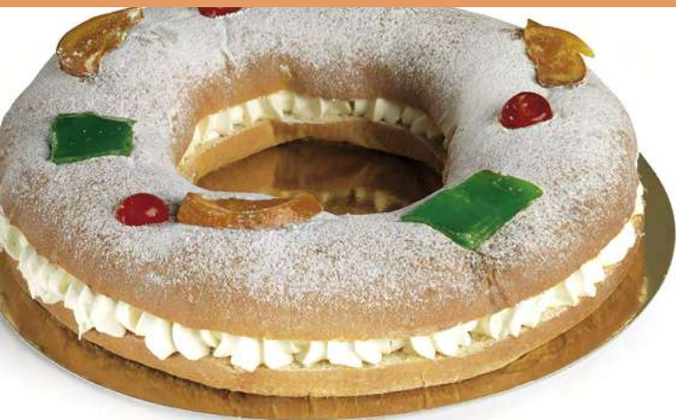
Roscón de Nata Premium (650 gr • 27 cm ø)