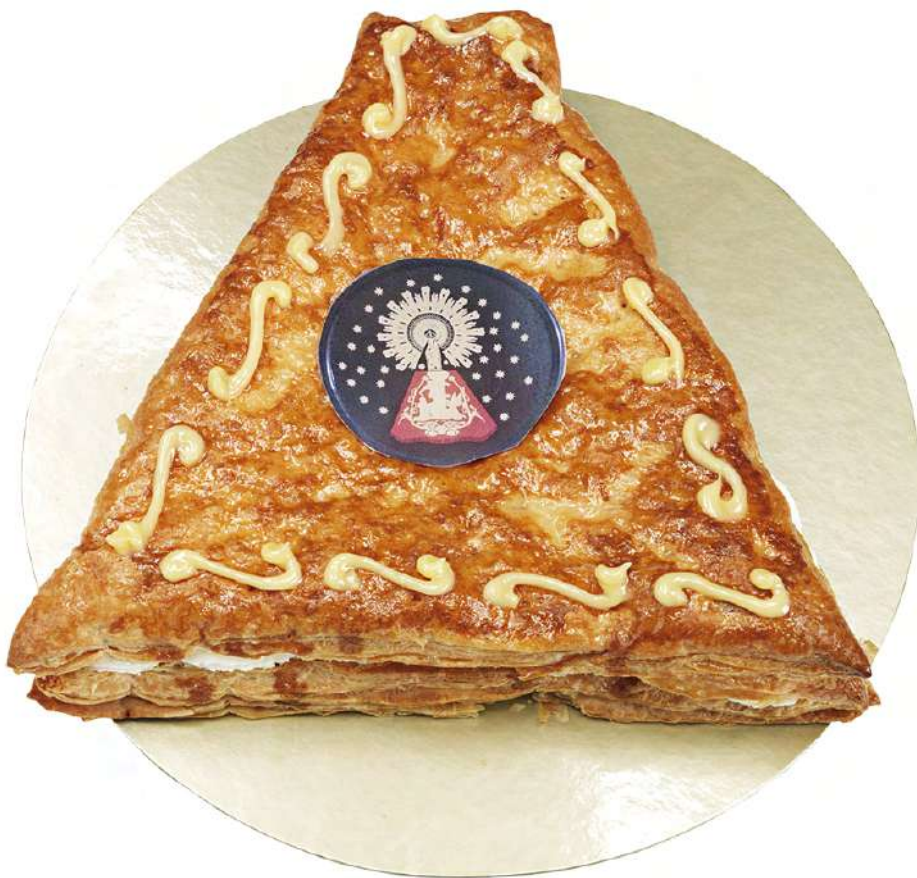
Manto del Pilar (500 gr)