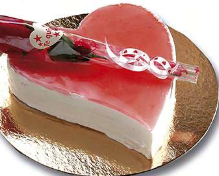
Corazón San Valentín Mousse