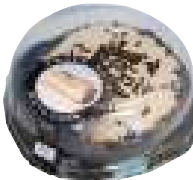
Trufa y Nata (550 gr)