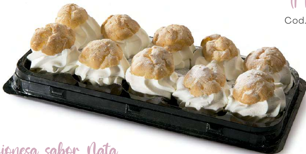
Lionesa sabor Nata