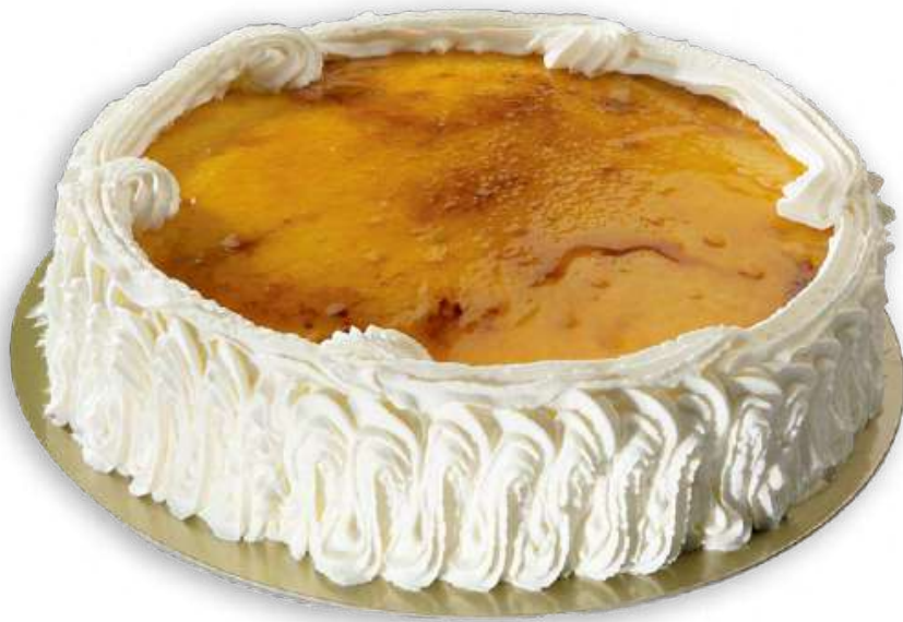
San Marcos (12 Raciones)