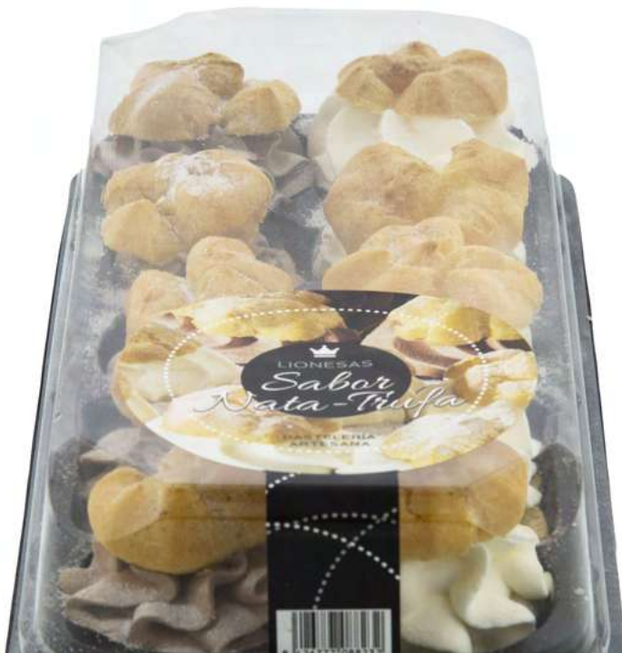
Lionesas Surtidas (250 gr)