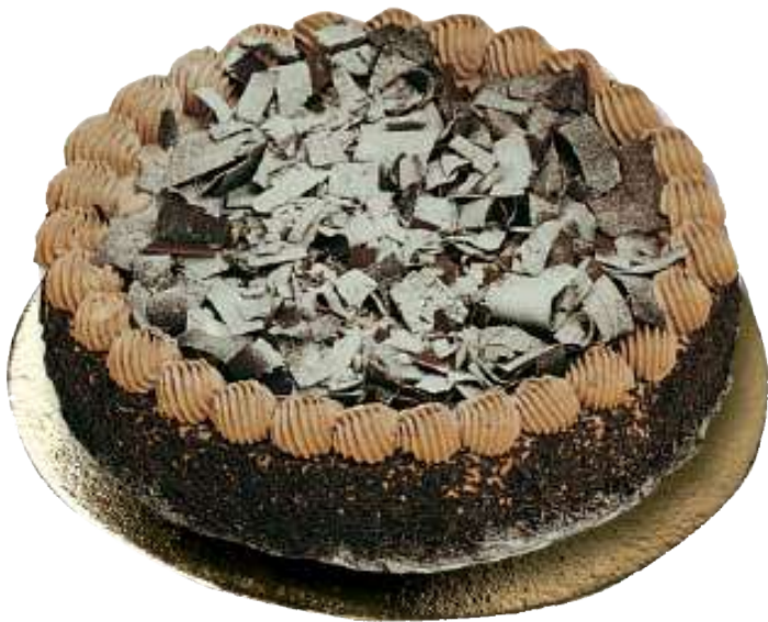
Selva Negra (8, 12 Raciones)