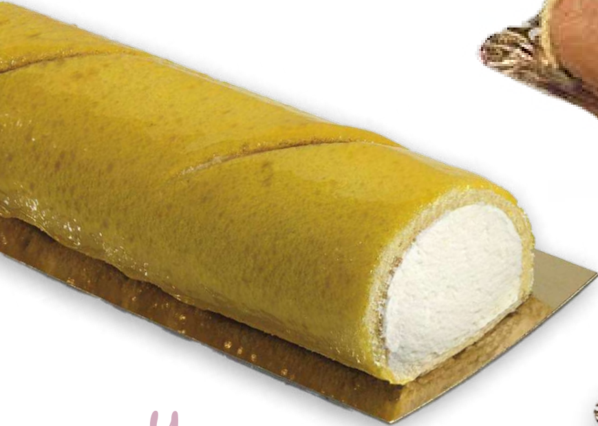
Yema (1 Kg)