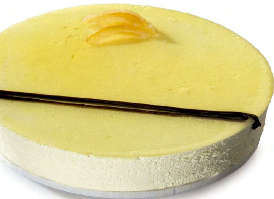
Mousse limón (550 gr)