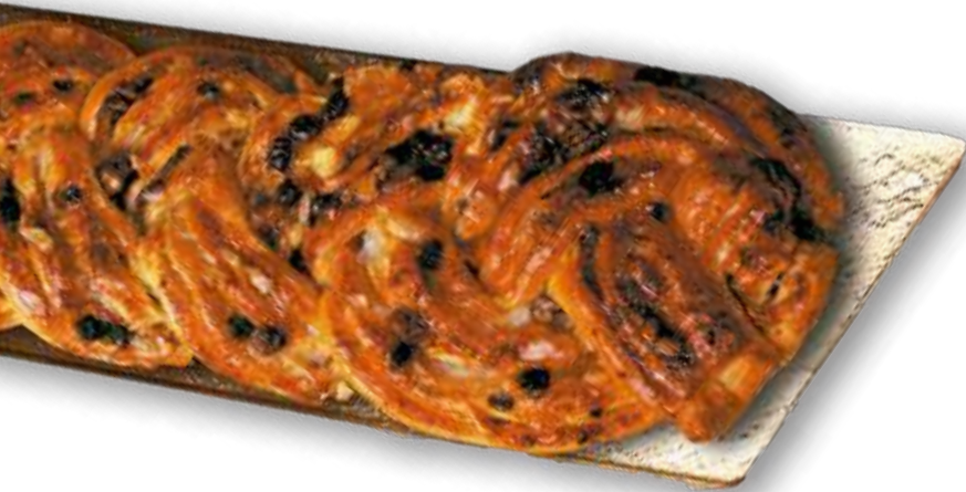
Trenza de Huesca (8 raciones)