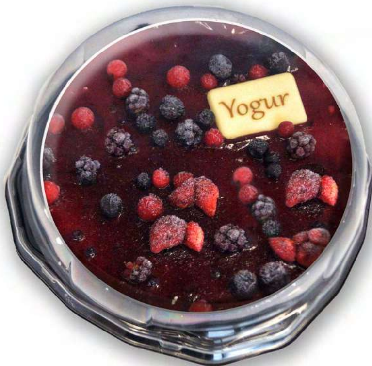
Crujiente (375 gr)